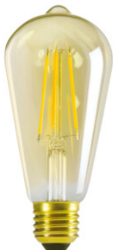
XLED ST64 7W