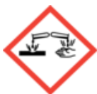
GHS05 Działanie żrące